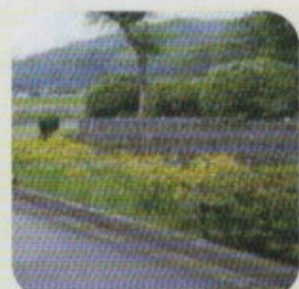
オオキンケイギク