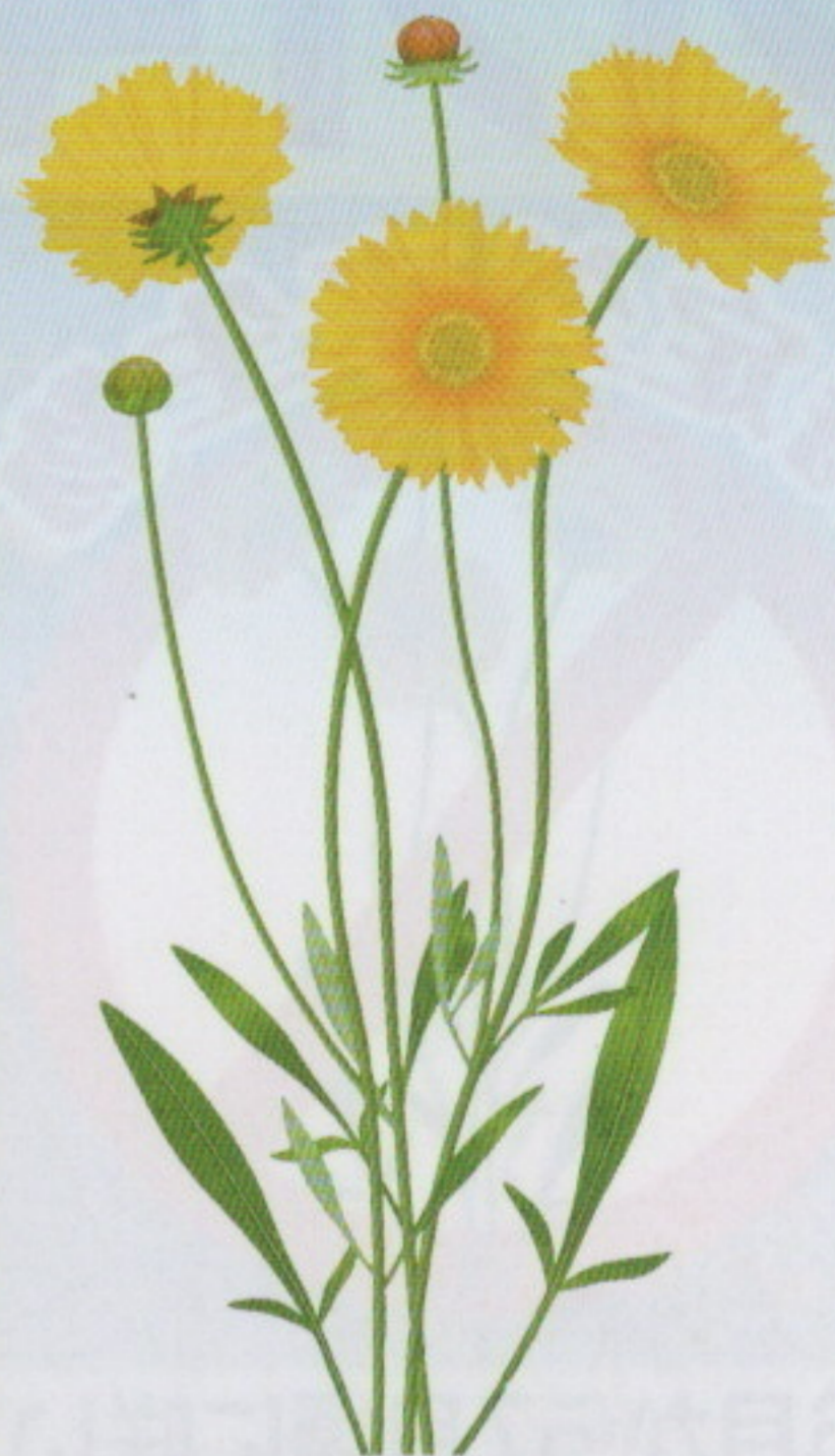
オオキンケイギク (キク科 多年草)