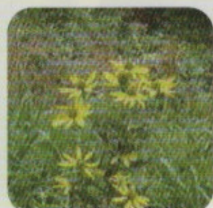
オオハンゴンソウ※①